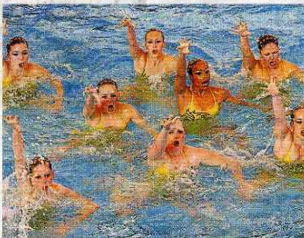
Nantes Natation a conquis le public mais c'est Aix qui a dominé les combinés des championnats de France.

À l'applaudimètre, Nantes Natation a sans conteste remporté l'épreuve des ballets combinés, hier soir à la piscine Léo-Lagrange. Mais les qualités techniques et la variété des chorégraphies des dix jeunes Nantaises n'ont pas suffi à emporter l'adhésion des juges. Sans surprise, le club d'Aix-en-Provence, l'un des mastodontes français, a dominé ces combinés toutes catégories. L'équipe provençale s'est imposée en devançant Angers et Lyon, devant 500 spectateurs